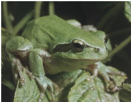
Abb. 25: Europäischer Laubfrosch ( Hyla arborea ).

Abbildungen und Tabellen werden durchnummeriert, mit einer aussagekräftigen Unterschrift versehen und müssen im Text referenziert werden. Beispiel: